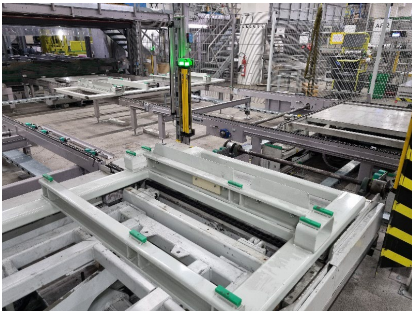
Figura 2 - Transportador de cadena transversal ampliado Por ello, junto con Vollert, se amplió el transportador transversal de cadena existente con cuatro estaciones intermedias adicionales. Esto crea capacidad para futuras optimizaciones de rendimiento, ya que permite que se almacenen varios Skids antes y después del puesto de trabajo.