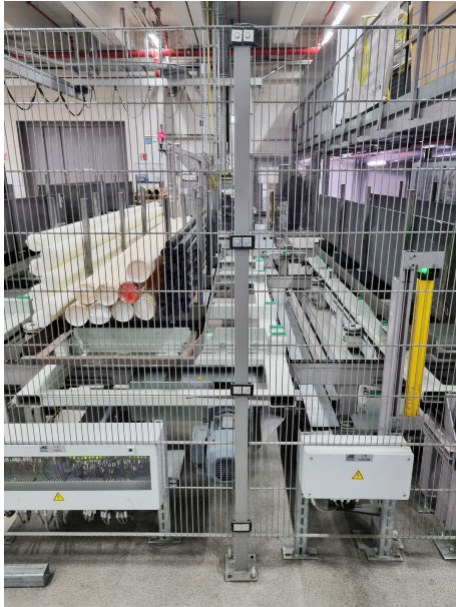
Figura 1 - Transportador de cadena transversal antes Cuello de botella en la producción. En Ensinger, las distancias de transporte demasiado cortas de un transportador transversal existente provocaban repetidamente retrasos y tiempos de espera durante el almacenamiento y la recuperación de un sistema de estanterías altas.